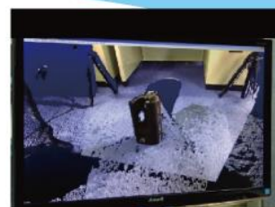
複数方向からの同時スキャン

ご用途に応じてすべての製品 / 技術をカスタマイズしてご提供します。お気軽にご相談ください。